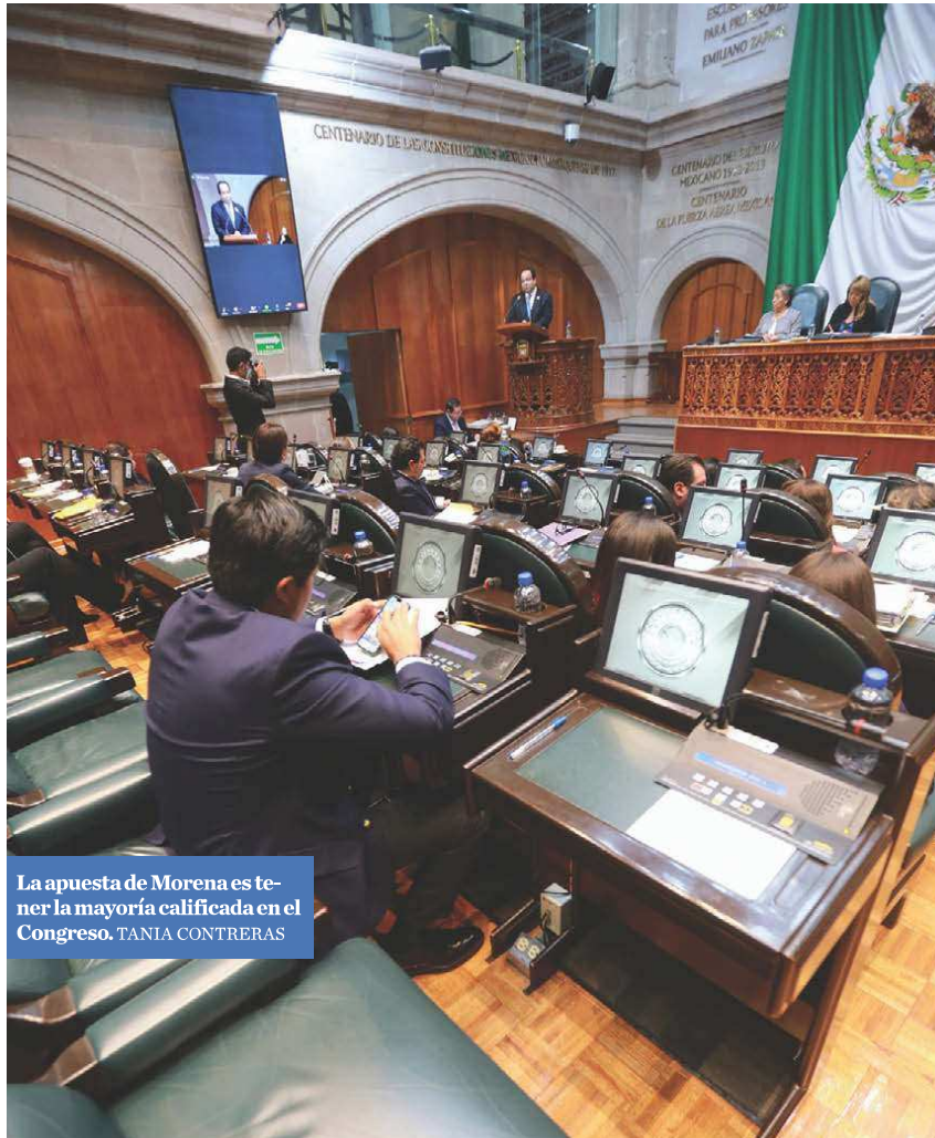
La apuesta de Morena es tener la mayoría calificada en el Congreso. TANIA CONTRERAS

Este 2 de junio, poco más de 13 millones de electores podrán acudir a las urnas para renovar los 125 ayuntamientos de la entidad, integrada por 125 presidencias, 135 sindicaturas y 966 regidurías, donde no basta con ganar la presidencia, sino se obtiene la mayoría de espacios en el cabildo, para poder operar sin