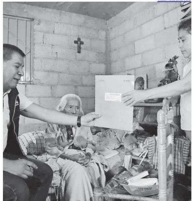
Debieron registrarse hasta el 22 de enero en la lista nominal de electores

Tanto el IEEM, como el Instituto Nacional Electoral buscan garantizar el derecho al voto para quienes por diversas