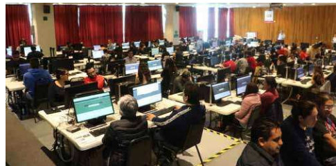
IEEM simuló ataques simultáneos en prueba del PREP para el día de la jornada electoral.

"Entonces realmente el PREP está listo para empezar a ofrecer los resultados a partir de las 20:00 horas con cortes cada 20 minutos y obviamente no hay posibilidad de un conteo rápido, el IEEM no lo tendrá, sólo habrá conteos rápidos para los cargos federales y para los cargos gubernamentales. En el caso local es complicado porque pues a veces los municipios son muy pequeños y no alcanza una muestra estadísticamente significativa, entonces por esa razón no los estaremos realizando", finalizó.